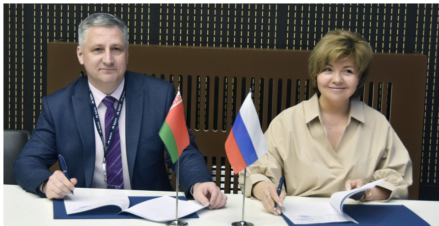
Торжественная церемония подписания Соглашения о присоединении к Международному Консорциуму MICE Индустрии

– Прежде всего мы обладаем высоким кадровым ресурсом, ведь выставочная отрасль – очень сложный вид деятельности, и она требует профессионального подхода.